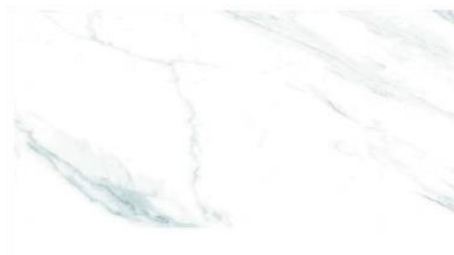
2. Fresno formato 19,50x84 cm