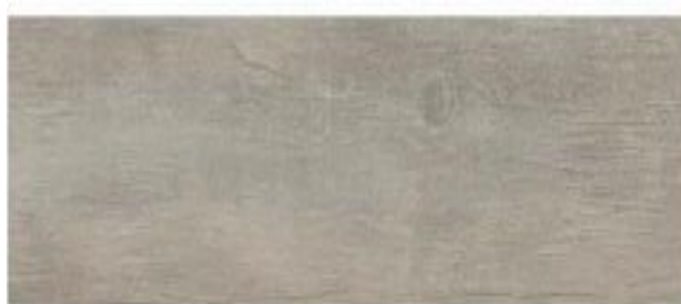
5. Powder Wood formato 22,50x90 cm.