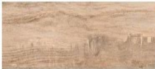
3. Foster formato 30x60 cm.