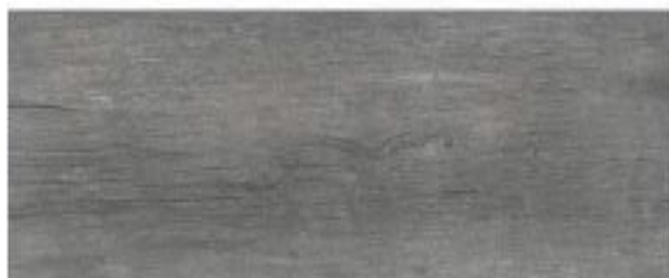
6. Cold decor Powder formato 60x60m.