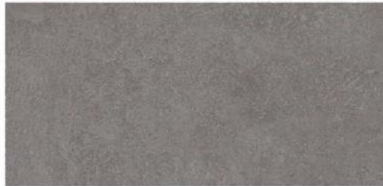
1. Calacatta formato 30x60 cm.

Pavimento y revestimiento de gres porcelánico (Cocina y baño) a escoger entre: